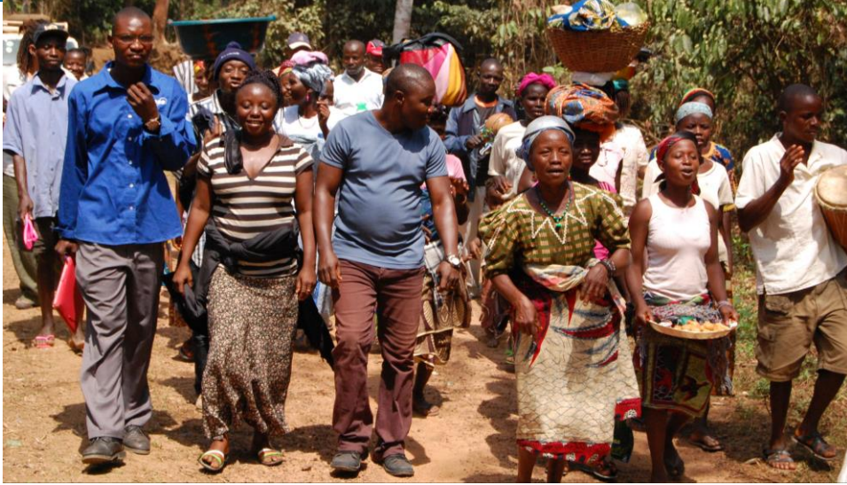
Uguaglianza al lavoro.